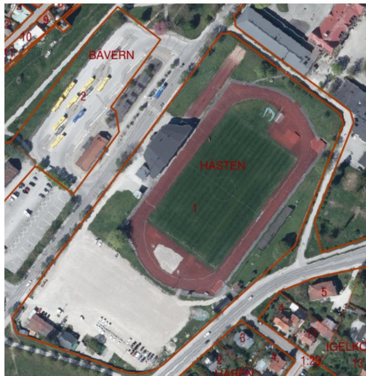
Figur, ortofoto över fastigheten Visby Hästen 1