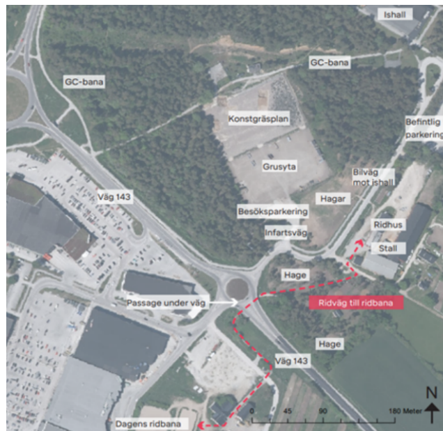
Figur, Befintligt förhållande inom området idag.

Fastigheten är belägen inom gällande detaljplan, 09-VIS-68, och utlagd som kvartersmark för idrottsändamål och dylikt. Den yta som föreslås bebyggas med en ridsportsanläggning avser den tidigare konstgräsplanen för fotboll som är belägen i fastighetens södra del. Konstgräsplanen är avvecklard och ytan har sanerats från markföroreningar och är möjlig för utveckling för annat ändamål. Detaljplanen reglerar inte byggrättens storlek som behöver fastställas inom en bygglovsprövning.