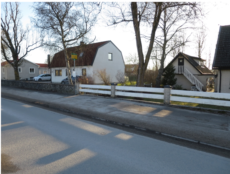
Figur 4: Hållplats Lönnvägen, läge B. I bakgrunden syns muren till den fastighet som används av väntande resenärer. Bild: Kollektivtrafikenheten, februari 2019.