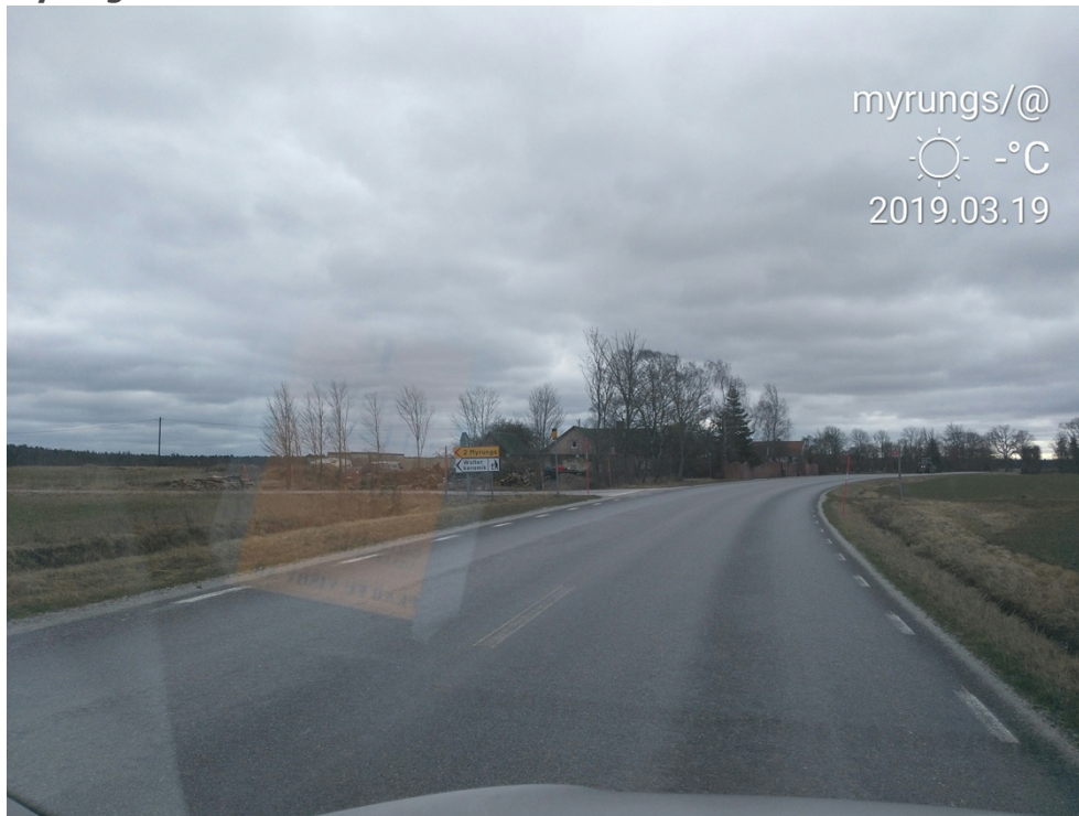
Figur 5: Hållplats Myrungs. Bild: PEAB, mars 2019.

Hållplatsen Myrungs i Linde trafikeras av linje 12. Förvaltningen vill ta bort hållplatsen av säkerhetsskäl. Vintern 2023/2024 körde bussen av vägen två gånger vid hållplatsen under halt väglag. Kurvan där hållplatsen ligger lutar nämligen på ett sätt som ökar risken för avåkningar. Det är inte fastställt i vilken mån bussarnas bromsande inför hållplatsen bidrog till olyckorna, men en stor del av förarkåren känner obehag inför att angöra hållplatsen i södergående riktning.