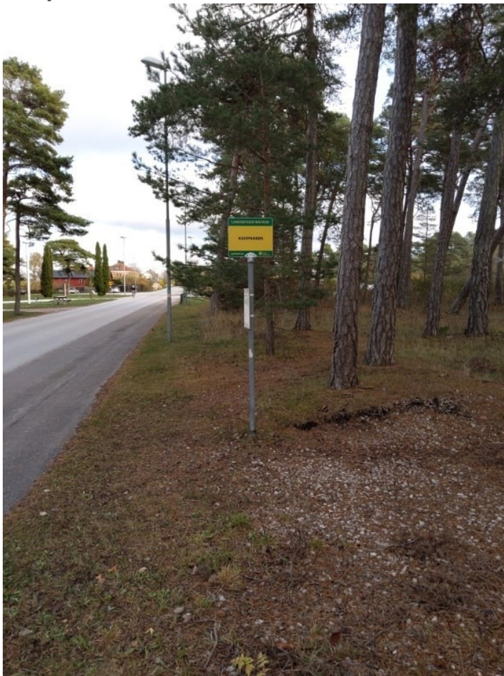
Figur 6: Hållplats Kustparken.

Hållplats Kustparken ligger längs Kustparksvägen i norra Fårösund. Hållplatsen finns främst till för att betjäna folkhögskolan, men trafikeras endast på vissa turer. För att trafikera hållplatsen måste linje 20 köra en omväg, vilket ökar restiden och försvårar passningen till Fåröfärjan. Enligt trafikförsörjningsprogrammet bör körvägar rätas ut och linjevarianter undvikas 5 Att ta bort hållplats Kustparken är ett steg på vägen för att nå det målet. Genom att ta bort hållplatsen sänks restiden på linje 20 med fem minuter.