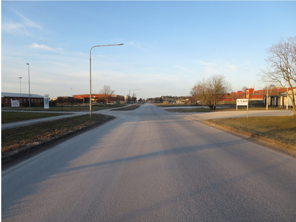
Figur 2: Hållplats Arla. Bild: Kollektivtrafiknheten, mars 2019.

Hållplatsen Arla ligger i östra Visby, på Lundbygatan. Hållplatsen trafikeras av linje 3. Hållplatsen ligger cirka 200 meter från sina två närmaste hållplatser, Privab och Farmek, som trafikeras av samma linje. Hållplatsen saknar hållplatsskylt och på- och avstigning sker i gräsytan på båda sidor om vägen. Vid snöfall är det svårt att snöröja hållplatsen på ett lämpligt sätt, och på sommaren behöver gräset klippas regelbundet. Gräsytorna längs Lundbygatan sköts som äng för att gynna den biologiska mångfalden, vilket innebär att gräset vid hållplatsen behöver klippas i en särskild insats.