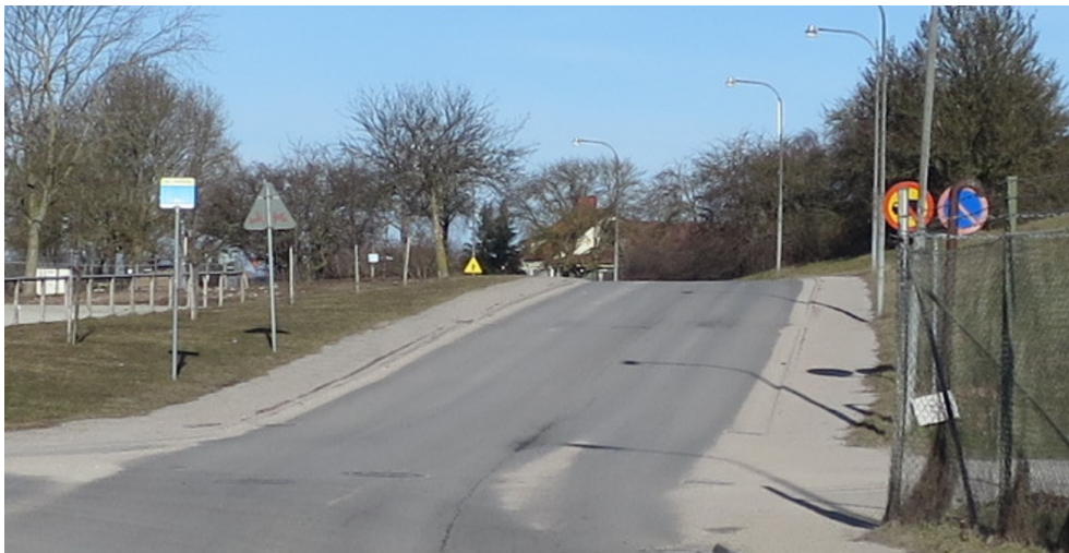
Figur 1: Hållplats Hansahälsan. Bild: Kollektivtrafikenheten, mars 2019.

Hållplatsen ligger i norra Visby och trafikeras av linje 1 och 5. Hållplatsen ligger i en backe, vilket är olämpligt för trafiksäkerheten. Cirka 140 meter bort ligger hållplats Atlasgatan, som trafikeras av samma linjer, ligger plant och är utrustad med väderskydd. På- och avstigning sker på gångbanor på vardera sidan av körbanan. Gångbanorna är för smala (cirka 1,3 meter) för att det ska gå att säkert gå av och på bussen med barnvagn, rullator eller rullstol.