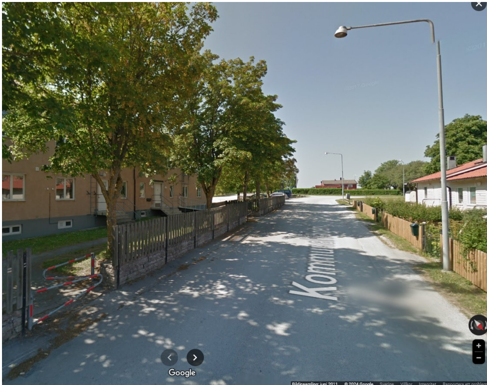
Figur 7: Hållplats Fårösundsskolan. Bild: Google, juni 2011.

Hållplats Fårösundsskolan ligger omkring 500 meter från huvudhållplatsen i Fårösund, Kronhagsvägen. För att trafikera hållplatsen måste linje 20 köra en omväg, vilket ger en högre restidskvot 7 . Enligt trafikförsörjningsprogrammet ska restidskvoten på linje 20 vara högst 1,4 till Visby 8 . Att ta bort hållplatsen är ett steg i riktning mot målet att sänka linje 20:s restidskvot enligt trafikförsörjningsprogrammet. Genom att ta bort hållplatsen sänks restiden med fem minuter. Tillsammans med borttagning av hållplats Kustparken kan man förkorta restiden på linje 20 med tio minuter.