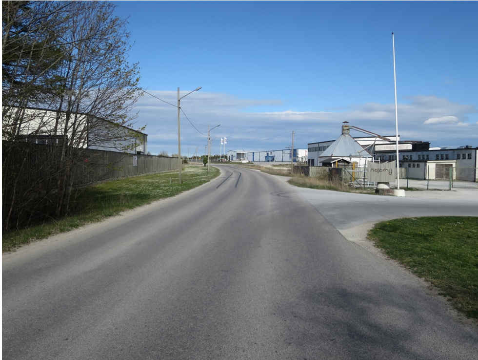
Figur 8: Hållplats Österby. Bild: Kollektivtrafikenbeten, april 2020.

Hållplats Österby ligger i industriområdet Österby i östra Visby. Hållplatsen ligger på linje 22, men trafikeras inte för närvarande sedan justeringar på linjen gjorts för att minimera förseningar. Turen 103 trafikerade tidigare Österby men då få eller inga använde hållplatsen blev det en nödlösning att inte trafikera den för att säkerställa ankomst till Visby busstation i tid för anslutande bussar, främst stadstrafik. Körtiden kortas endast med cirka två minuter men då det handlar om turer rusningstrafik gör det skillnad. Vidare är mål i trafikförsörjningsprogrammet att sänka restidskvot, göra linjer rakare och att undvika linjevarianter. Så, antingen bör samtliga turer på linje 22 köra via hållplats Österby eller inga.