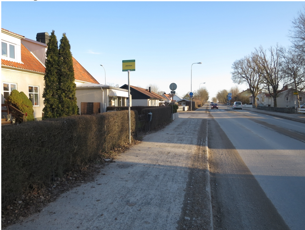
Figur 3: Hållplats Lönnvägen, läge A. Bild: Kollektivtrafikenheten, februari 2019.