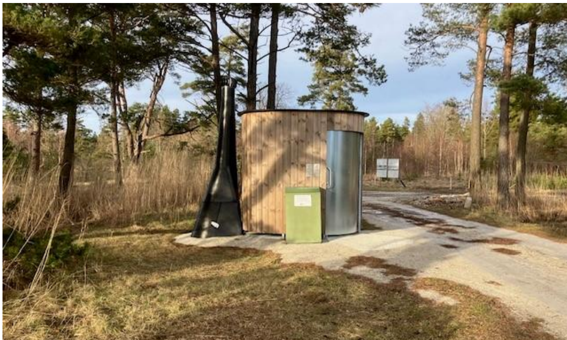
Alltoa vid Bungevikens badplats

De årliga investeringskostnaderna på bad- och besöksplatser landar i denna plan på mellan 500 och 600 tusen kronor med undantag för 2024 där flera projekt påbörjats med överflyttade investeringsmedel från tidigare år samt med medel från andra håll.