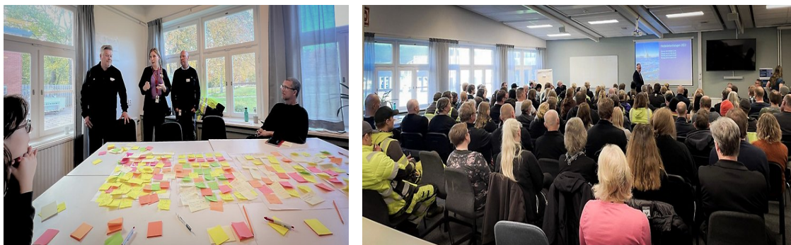
Bilder från 2023 års medarbetardialog