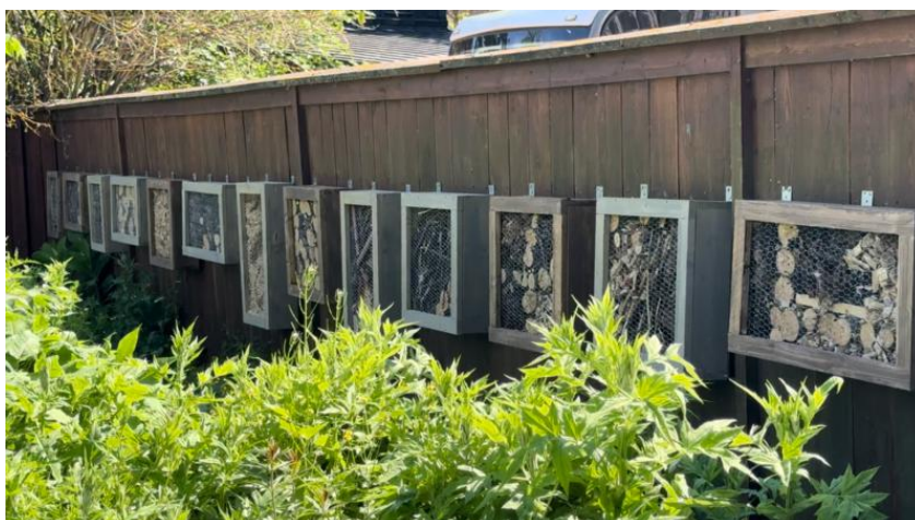
Bild på nybyggt bihotell

För att få uppslag till ”Årets happening” från teknikförvaltningen gjordes i år en tävling bland medarbetarna på parkenheten och det vinnande bidraget blev bihotell för insekter och nio stycken bihotell har hittills placerats ut runt om på ön. Hotellen är viktiga för den biologiska mångfalden och finns i olika material, för att gynna binas byggande av bon. Förhoppningen är också att hotellen ska inspirera allmänheten att bygga egna bihotell.