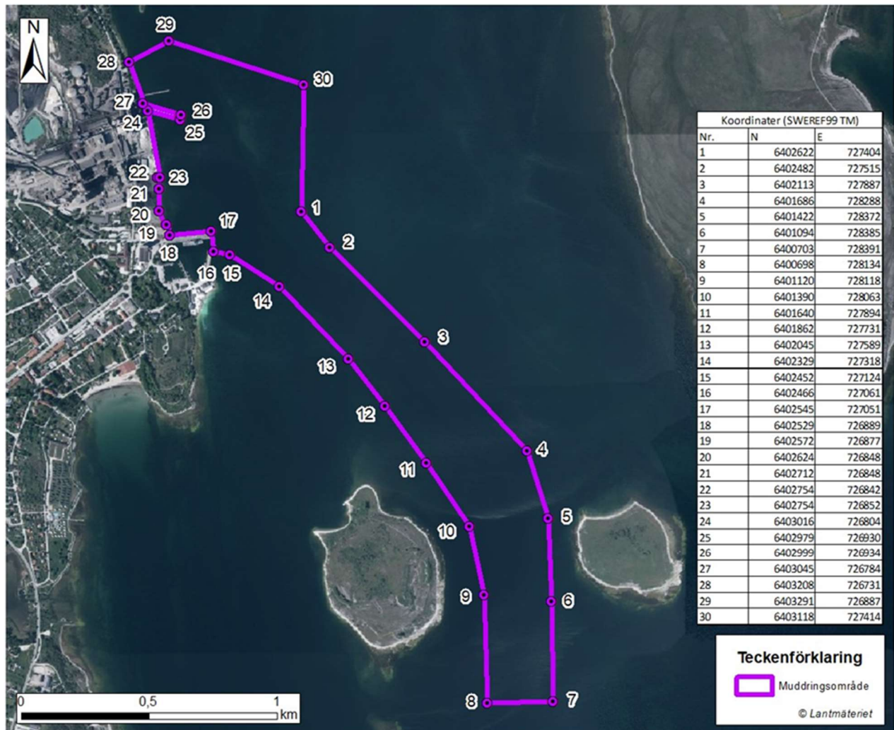
Figur 1. Karta till yrkande 2d: Muddringsområde med hörnkoordinater.