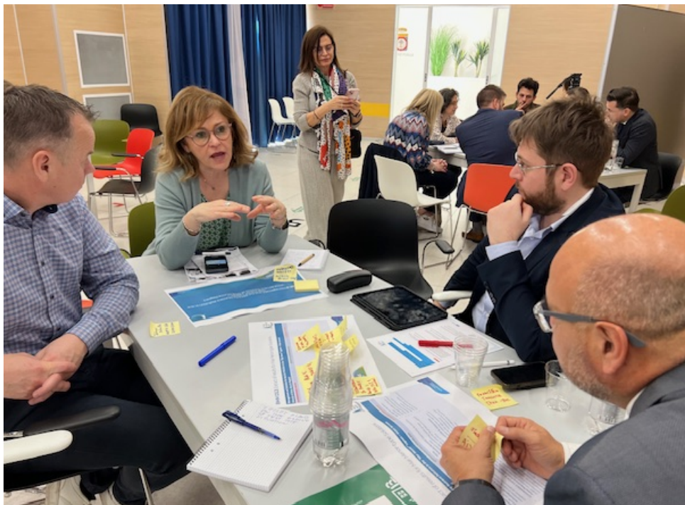
Bild. Workshop om vattenresiliens.

Synpunkter från deltagare i salen speglade hur öar ofta saknar kapacitet att själva lösa vattenutmaningar. Representanter från Katalonien, Andalusien och Västra Grekland lyfte behovet av effektiv distribution, avsaltning och bättre vattendata. Samordning på nationell nivå samt investeringar i teknik och infrastruktur sågs som avgörande för att säkra framtidens vattenresiliens.