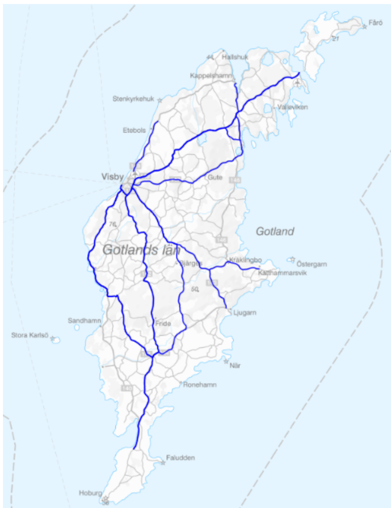
Bild 2.1 Funktionellt prioriterat vägnät för Gotland. Sammantaget utpekande för dagliga och långväga personresor, godstransporter och kollektivtrafik. Källa: Nationella vägdatan, hämtad 2025-04-29.

Inom ramen för Trafikverkets ansvar ligger även vägfärjetrafiken till och från Fårö. Regionfullmäktige valde i februari 2021 att inte gå vidare i planeringen för en bro under de förutsättningar som Trafikverket ställde upp avseende finansiering. Region Gotlands ställningstagande för en bro mellan Gotland och Fårö kvarstår dock alltså.