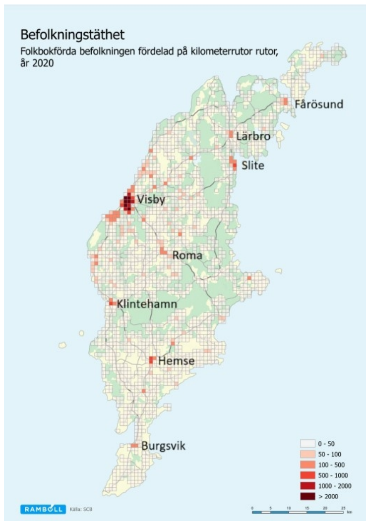
Bild 2.2 Befolkningstäthet. Folkbokförda befolkningen fördelad på kilometerrutor, år 2020. Ju mörkare färg på kartan (vitt till rött), ju fler bosatta inom respektive kvadratkilometer.

Själso. Mindre tätorter med mellan 200 och 500 invånare är på södra Gotland Havdhem, Stånga och Burgsvik, och på norra Gotland Lärbro och Tingstäde. 4