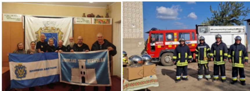
Swedish rescuers och Berislavs kommun Det nya brandvärn

Ett nytt brandvörn har invigts i Berislavs Kommun, med en besättning från Gammalsvenskby. När situationen är lugnare ska den förläggas till Gammalsvenskby. Det har kunnat skapas tack vare insatser från Föreningen Svenskbyborna, Region Gotland, Gotlands Museum och Swedish Rescuers.