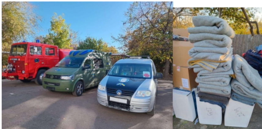
Några av de levererade bilarna.