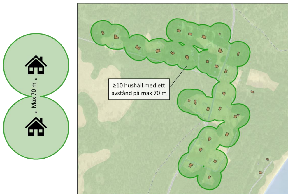
Figur 3. Principer vid identifiering av VA-planområden i GIS-analysen.