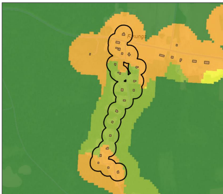
Figur 6. Riskbedömning för påverkan på hälsoskydd för område Rute Risungs (nr 15) i nordöstra Gotland.

Vid användning av GIS-stödet kan ett VA-planområde innehålla flera färger på riskbedömningsskalan. Poängen för den färg som täcker majoriteten av området har valts. I enstaka fall har ett medelvärde på riskbedömningsskalan valts, som exempelvis i fallet som visas i Figur 6. Hälften av VA-planområdet i figuren täcks av orange färg, som motsvarar 3 poäng på riskbedömningsskalan och andra hälften av ljusgrön färg, 1 poäng på skalan. För detta VA-planområde har 2 poäng valts på riksbedömningsskalan för påverkan på hälsoskydd.