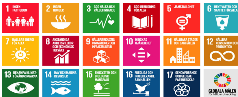
Globala målen, Agenda 2030

Regionfullmäktiges prioriteringar gäller under perioden 2024–2027. Prioriteringar har en direkt koppling till Region Gotlands hållbarhetsarbete och insatserna som sker inom respektive prioritering bidrar till målen i den regionala utvecklingsstrategin och de globala hållbarhetsmålen. Prioriteringarna får kraft och når förflyttning genom insatser. Insatserna kan vara nämndspecifika eller genomföras i samarbete med flera nämnder.