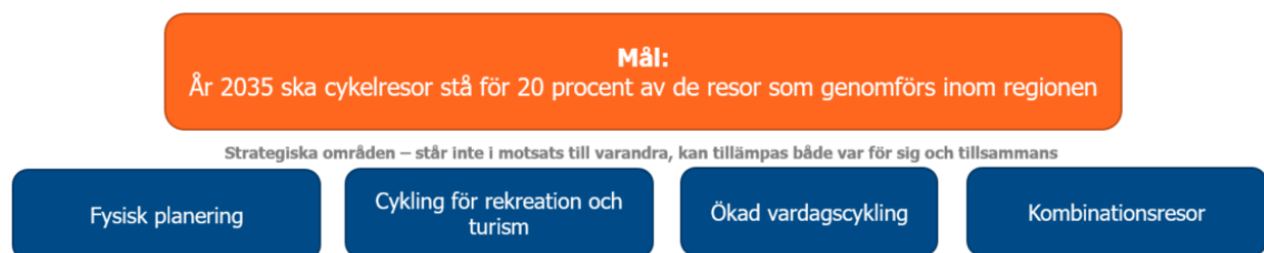
Bild 1. Den regionala cykelplanens mål nedbrutet i fyra fokusområden.

Fyra fokusområden har identifierats som särskilt viktiga för att främja ökad och säker cykling på Gotland (se bild 1). Respektive fokusområde består av ett antal insatser, som gemensamt kan bidra till att uppnå den regionala cykelplanens mål om ökad cykling till år 2035. Insatserna konkretiseras i aktiviteter. Region Gotland är huvudansvarig för huvuddelen av aktiviteterna, men flera av aktiviteterna kräver också andra aktörers engagemang.