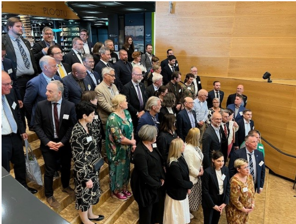
Bild. Årsmötet avslutades traditionsenligt med en så kallad "familjebild".