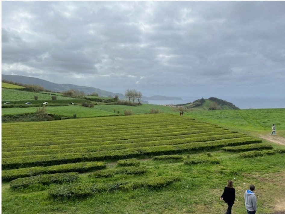
Bild. Azorererna är enda stället i Europa där det finns teodlingar.

Avslutade konferensen med att sammanfatta diskussionen med att öars utveckling kräver en engagerad samverkan kring sammanhållningspolitiken och andra politikområden. Han betonade även Azorernas särskilda erfarenheter av multi-insularitet.