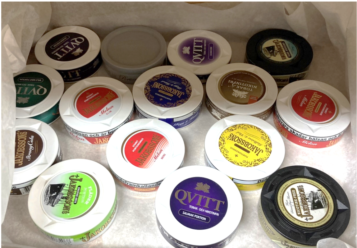
Ur Gotlands Museums samlingar: Snusdosor.

Framtagen av regionstyrelseförvaltningen Gäller 2023