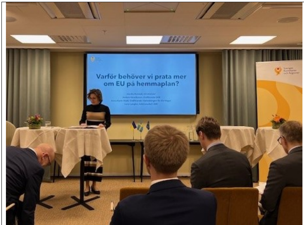
Bild. EU-minister Jessica Roswall

Sverige har ett antal prioriteringar för nästa kommission: