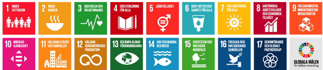
De globala målen i Agenda 2030