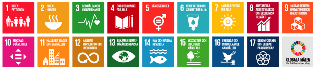
De globala målen i Agenda 2030