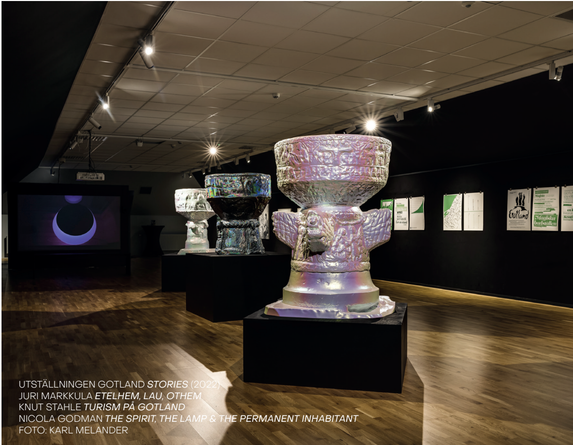
UTSTÄLLNINGEN GOTLAND STORIES (2022) JURI MARKKULA ETELHEM, LAU, OTHEM KNUT STAHLÉ TURISM PÅ GOTLAND NICOLA GODMAN THE SPIRIT, THE LAMP & THE PERMANENT INHABITANT