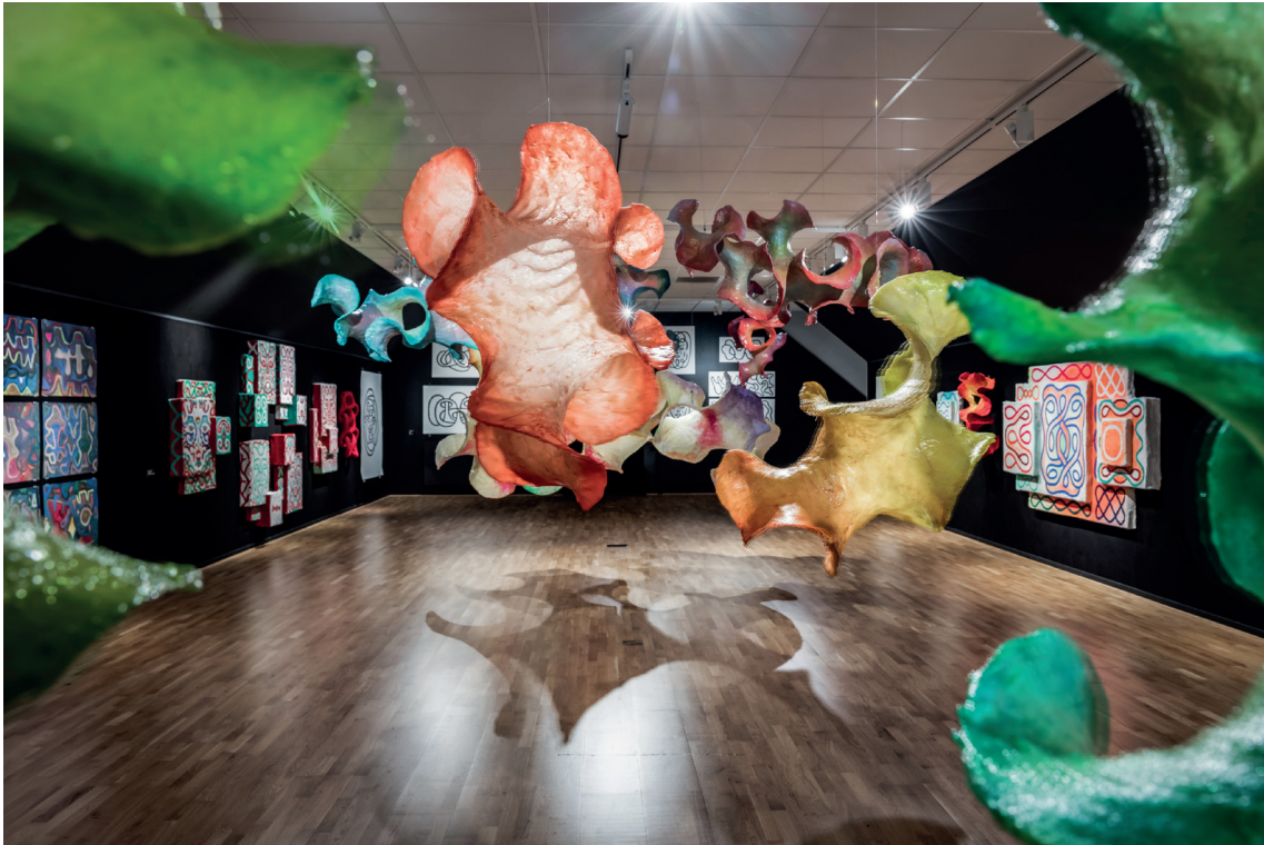
ÖVERSIKTSBILD AV UTSTÄLLNINGEN BÄRVÅG AV MATTI KALLIOINEN. (2023)