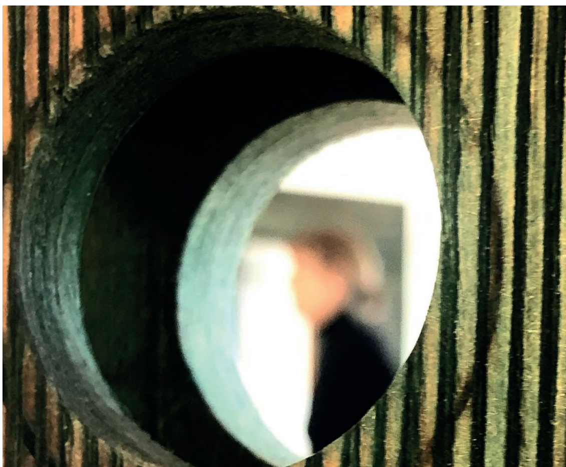
BILD TAGEN I UTSTÄLLNINGEN MELLAN OSS AV JONNA HÄGG

I huset finns personal som arbetar med konst och form samlad, vilket inkluderar verksamhetsansvarig för Konstmuseet, konstpedagogen/konstutvecklaren, slöjd- och formutvecklarna och intendent för offentlig konst. I byggnaden finns också resurscentrum representerat som bidrar till delaktighet med det lokala konstlivet.