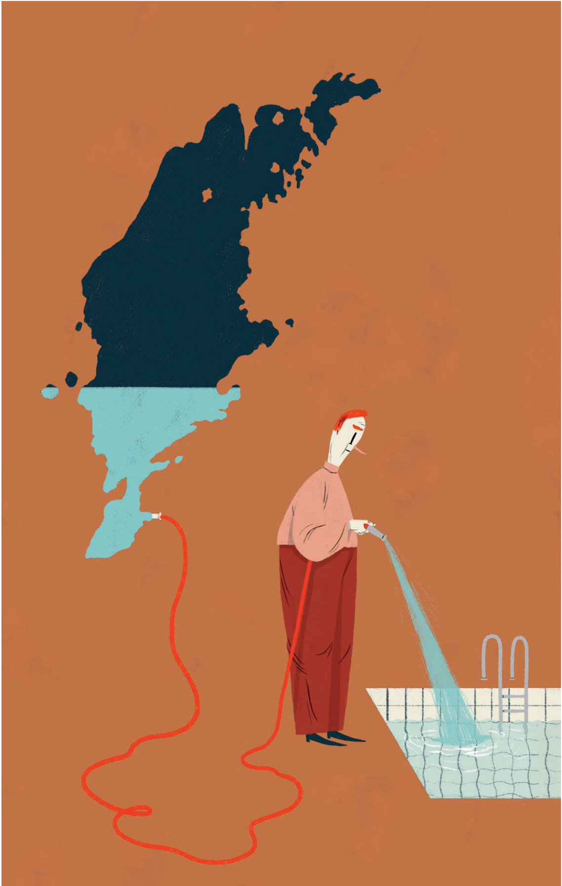
EMMA HANQUIST REFLEKTERAR ILLUSTRATION AV EMMA HANQUIST (2022)