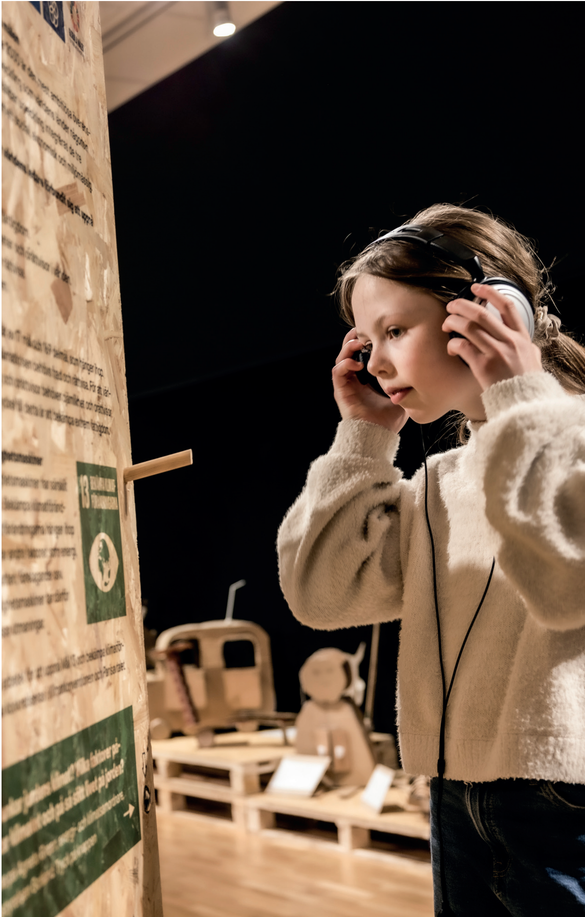
UTSTÄLLNINGEN MÖJLIGHETSMASKINER (2023)