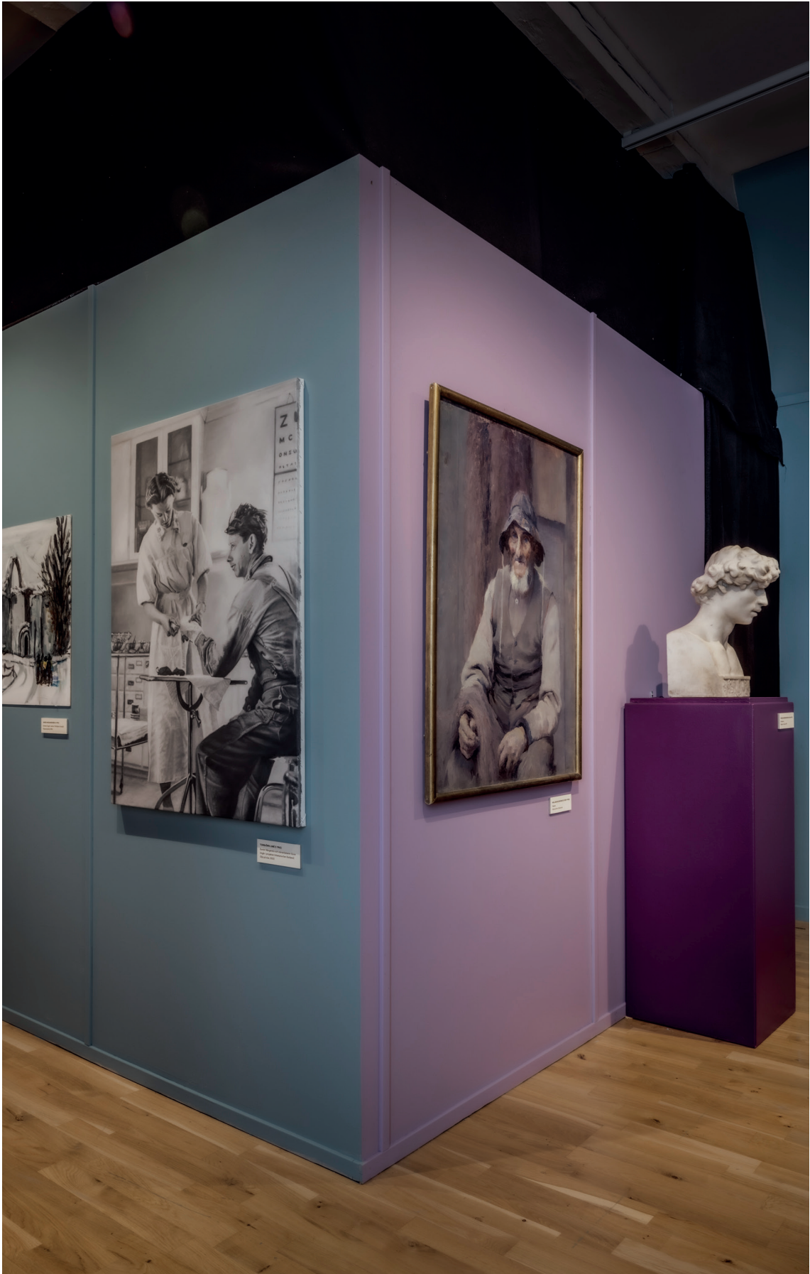
UTSTÄLLNINGEN KONSTLIVET TORBJÖRN LIME STENARBETAREN SUNE OCH SJUKSKÖTERSKAN MARGARETA (2022) WILLIAM BLAIR BRUCE FISKAREN , CAROLINA BENEDICKS BRUCE DRÖMMAREN (1891)