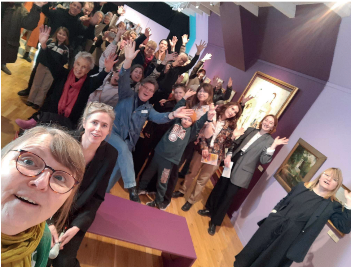
GRUPPBILD (WEFIE) FRÅN VERNISSAGE AV KONSTLIVET (2023)

Museet är en attraktiv mötesplats där man vill tillbringa tid och hänga på. Dit man kommer för en utställning, ett samtal, en visning, workshop, eller för att mötas. Här pågår alltifrån konstnärspresentationer, filmvisningar och konstboksreleaser, till fortbildningar och workshops. Museet sänker trösklarna till institutionen genom programverksamhet som gör lokalsamhället delaktigt samtidigt som man värnar om kvaliteten gällande utställningarna. Det lokala konstlivet engageras genom programverksamhet och nätverksträffar. Likaså genom initiativ som Open Calls och juryuttagna utställningar.