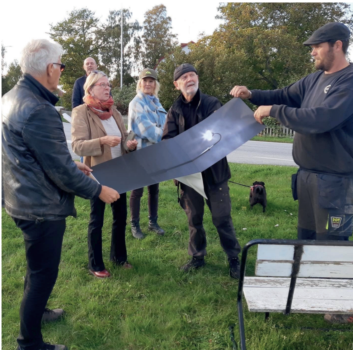
INSTALLERINGSBILD PROJEKT FEJS & PLEJS (2022) AV TOMMY SÖDERLUND OCH CARINA JOHANSSON

Gotlands Konstmuseum utvecklar samarbeten och långsiktiga relationer med andra konstinstitutioner och konstaktörer regionalt, nationellt och internationellt. Konstmuseet knyter an till nya nätverk som är inriktade på samtidskonst och samtida visuell kultur. Museet samarbetar med skolor, universitet och andra utbildningar samt med civilsamhälle, näringsliv och besöksnäring. Gotlands Konstmuseum samarbetar och ingår i arbetet med resurscentret Konst och Form på Gotland , vilket innefattar att utveckla en plattform för konstens aktörer och intressenter på ön.