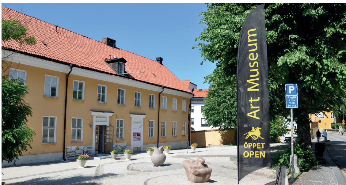
GOTLANDS KONSTMUSEUM.

Gotlands Museum har med hjälp av teknikonsultföretaget SWECO utfört en förstudie angående konstmuseiverksamhetens fysiska placering. Därefter har Gotlands Museum fastslagit att man vill fortsätta bedriva konstmuseiverksamhet i de befintliga lokalerna på Sankt Hansgatan. En programhandling, som innebär en beskrivning hur lokalerna behöver anpassas till verksamhetens behov är framtagen. Nästa steg är att arbeta med finansiering och projektering av ombyggnaden.