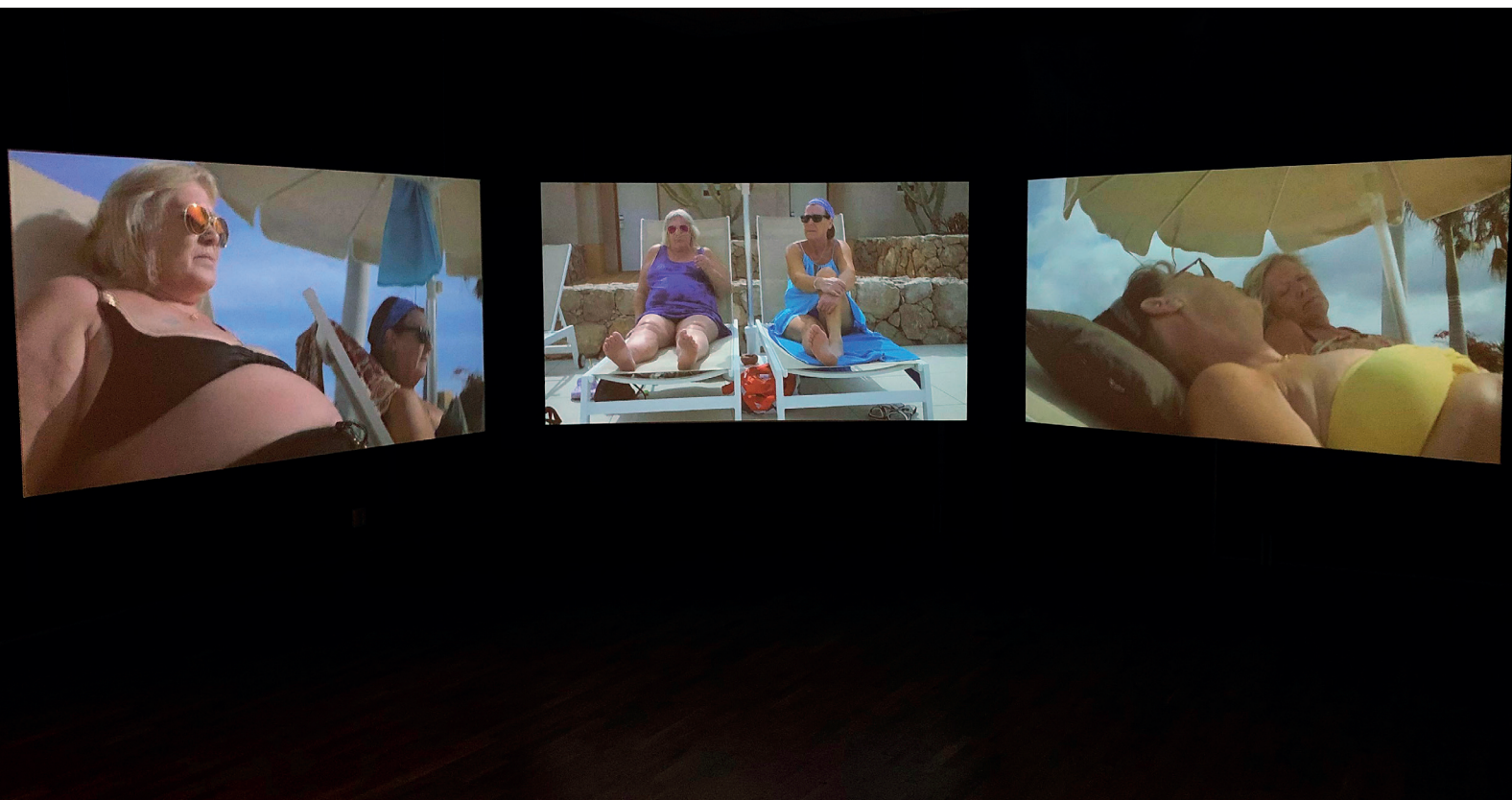
INA PORSELIUS ALLTING GÅR ÖVER OM MAN BLUNDAR (2017) VIDEOINSTALLATIONEN INGICK I UTSTÄLLNINGEN LEVA LIVET .

Att museet har ett gott samarbete med konstnären är av stor vikt. Tillsammans med konstnärer och andra aktörer undersöker och följer Konstmuseet konstens och utställningsmediets potential och möjligheter.