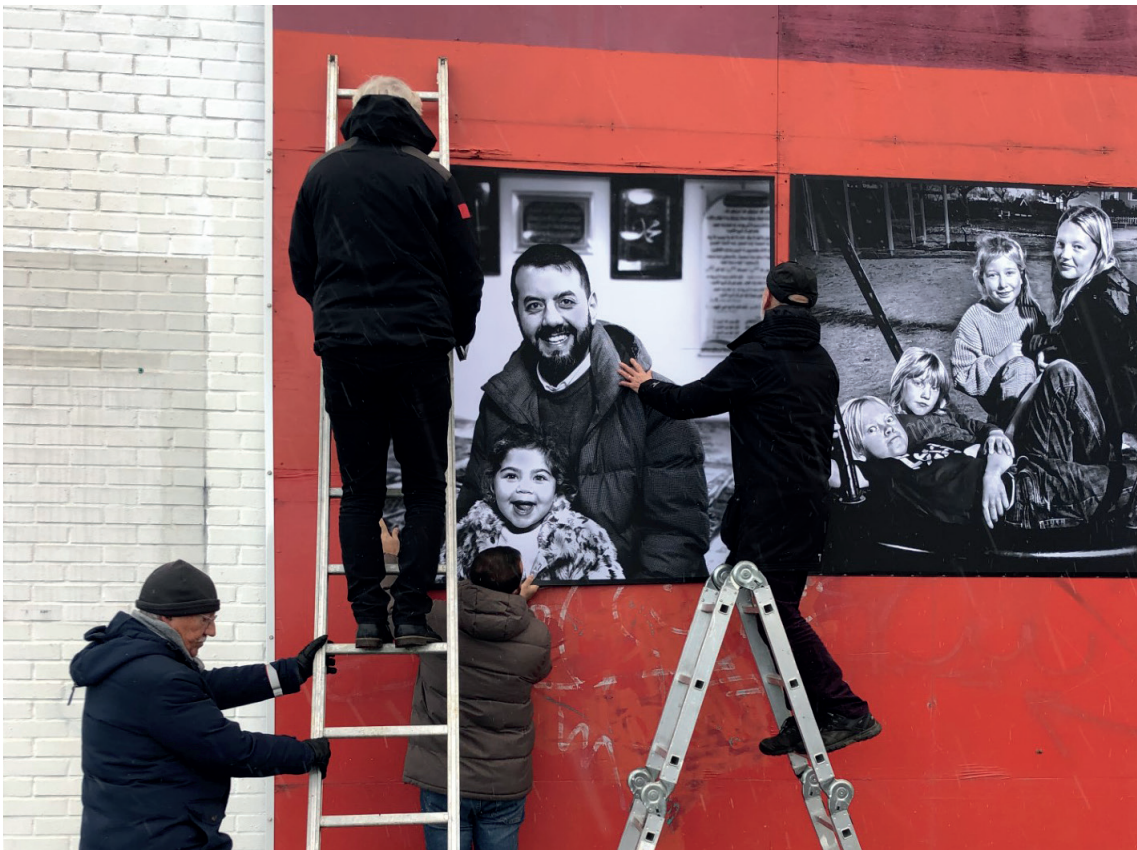
INSTALLATIONSBILD FRÅN BINGEBY, VISBY. PROJEKT FEJS & PLEJS AV TOMMY SÖDERLUND OCH CARINA JOHANSSON