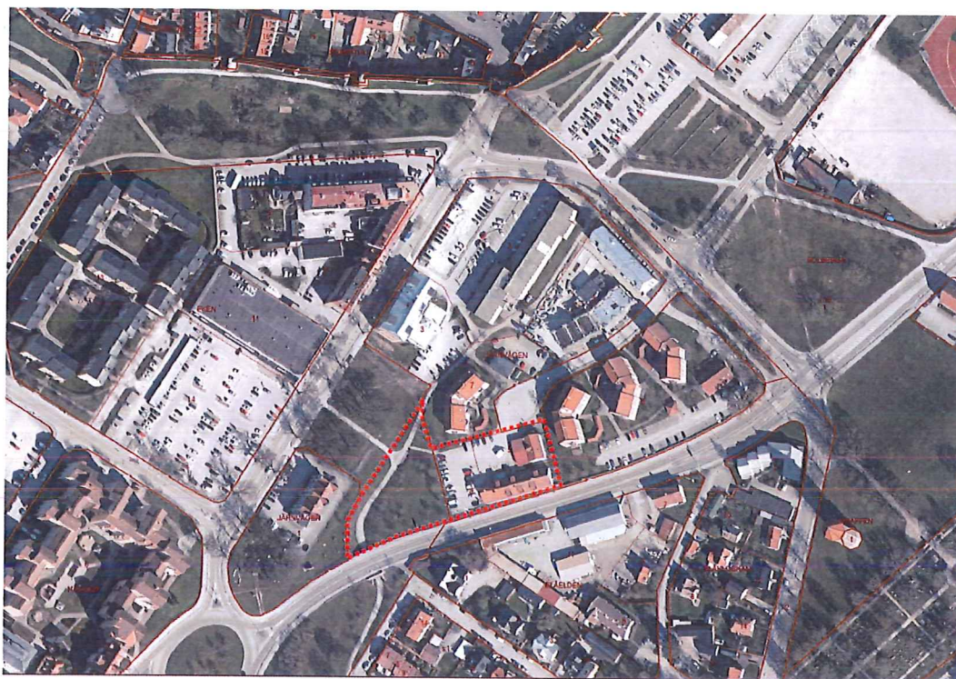
Bild 1. Översiktskarta.

Fastigheterna Visby Järnvägen 5 och 8 är belägna i södra delen av kvarteret Järnvägen längst in på Mejerigatan och mitt emot Björkmans byggvaruhus på Solbergagatan. Inom fastigheterna finns två byggnader i cirka 1,5 våningar och en del parkmark. Parkdelen utgörs av en gräsmatta med cirka 22 träd med en ålder på cirka 30 år och stamdiameter 12-30 cm, samt ett buskage med vresros.