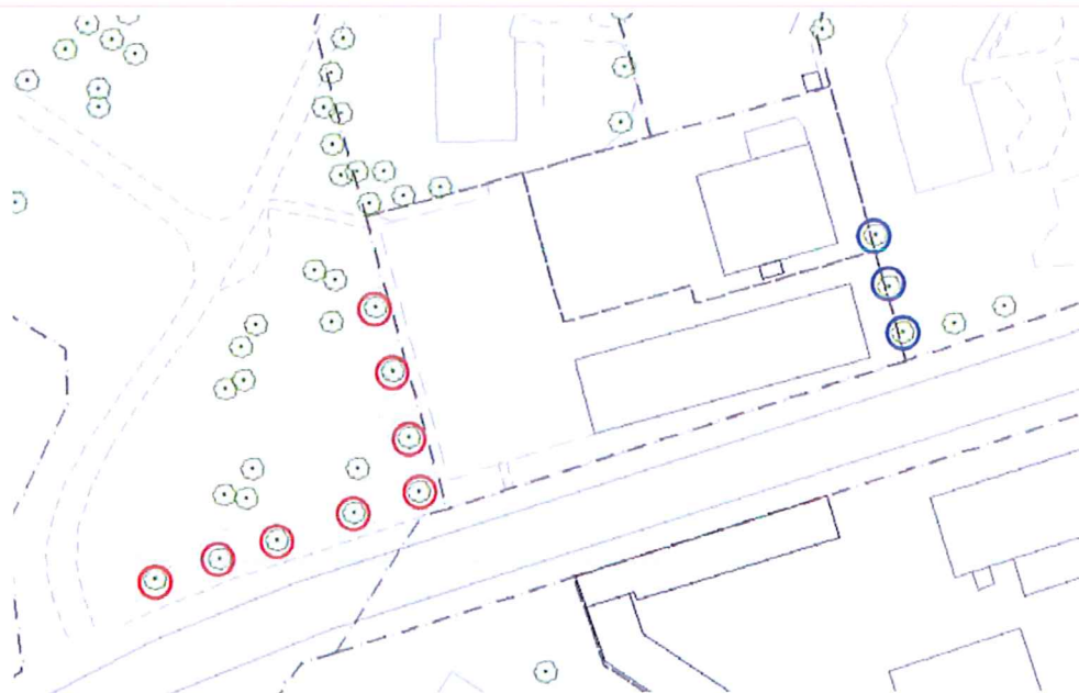
Alléträd som behöver ersättas eller flyttas markerade med röd ring. Alléträd som bör bevaras men som kan kräva dispens för markgrepp markerade med blå ring.

Ytterligare en trädrad finns strax utanför områdets östra del, träden utgörs av mindre skogslönnar. Planen utgår från att dessa träd bevaras. Dispens kan krävas i samband med markarbeten i dess närhet. Åtgärder som kräver markgrepp ska placeras och utföras så att alléträden inte skadas.