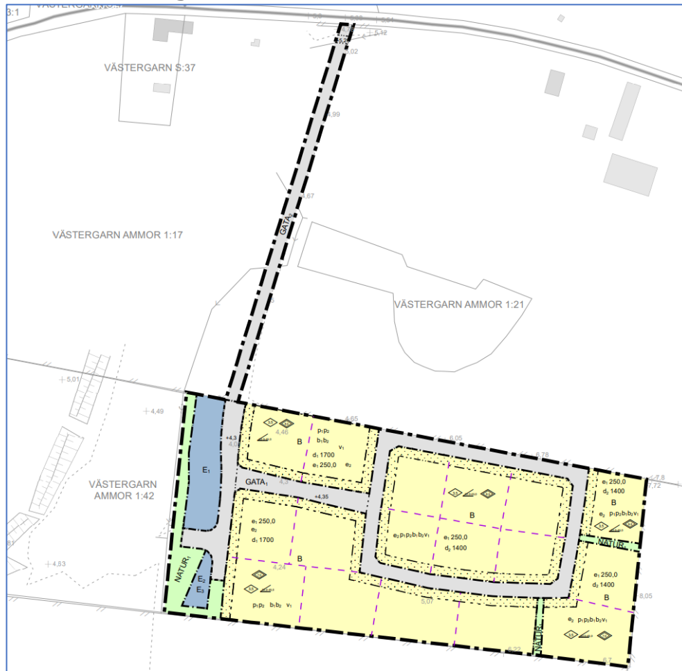
Detaljplane- och exploateringsområde