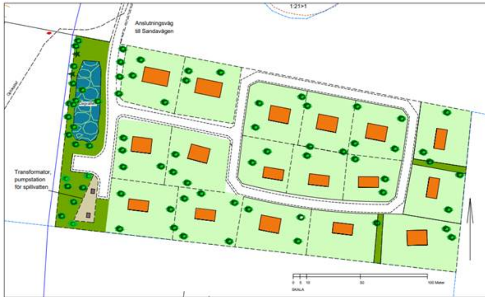
Illustrerad utformning av detaljplane- och exploateringsområdet