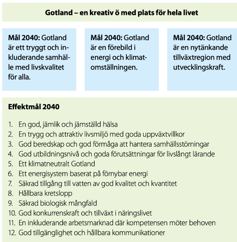
Figur 1. Illustration av den regionala utvecklingsstrategins vision till år 2040, dess övergripande mål samt effektmålen.

En ny regional utvecklingsstrategi för Gotland, Vårt Gotland 2040, antogs av regionfullmäktige i februari 2021. ÖP 2040 bygger vidare på strategin och är dess fysiska uttryck. I planen anges vilken utveckling och vilka förändringar som behövs på marken för att nå visionen för Gotland till år 2040. Visionen är att Gotland ska vara en kreativ ö med plats för hela livet, se figur 1. ÖP 2040 ska bidra till att hållbart utveckla hela Gotland med 92 socknar och skapa förutsättningar för bostäder, levande landsbygd och stärkta tätorter. Planen föreslår inga nya mål eller inriktningar, utan konkretiserar strategins ambitioner.