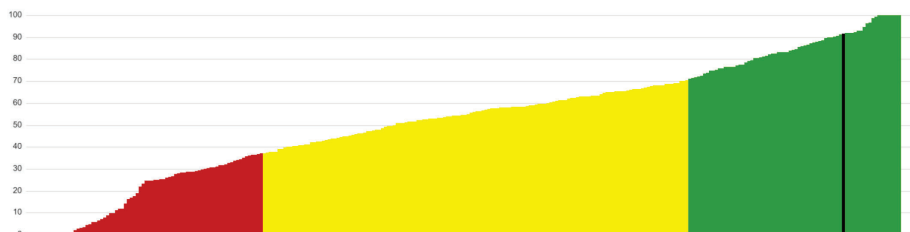
Kvalitetsindex förskola, Gotland, värde: 91, år: 2023.

Indexet baseras på andel med förskollärlärolegitimation i kommunal förskola, andel barn 1-5 år i kommunen inskrivna i förskolan och personaltäthet i kommunal förskola. Värdet placeras på en skala från 0 till 100 där 0 är sämst och 100 är bäst. Region Gotland har ett värde på 91.