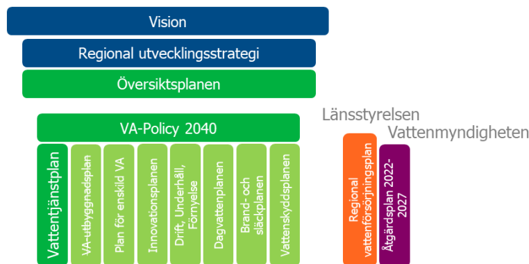
Figur 1: Illustrerar hur VA-policy 2040 förhåller sig till andra styrande planer och dokument, både Region Gotlands egna samt sådana från externa myndigheter. Namn och årtal på planerna kan komma att ändras över tid.

Figur 1, nedan, illustrerar hur den regionala utvecklingsstrategin – Vårt Gotland 2040 – och visionen anger den långsiktiga inriktningen för hur Gotland ska utvecklas. Dessa utgör därmed även utgångspunkt för VA-policy 2040. Under VA-policy 2040 återfinns de delplaner som tillsammans utgör nuvarande Vatten- och avloppsplan för Gotland (VA-plan 2018), som gäller åren 2018-2030. Som en följd av ändringar som inträdde den 1 januari 2023 i lag (2006:412) om allmänna vattentjänster, LAV, ska Sveriges kommuner från den 1 januari 2024 ha en aktuell vattentjänstplan. Nuvarande VA-utbyggnadsplan 2018 (senast uppdaterad 2022) kommer framgent att ingå i vattentjänstplanen och presenteras därför nedan som genomstruken.