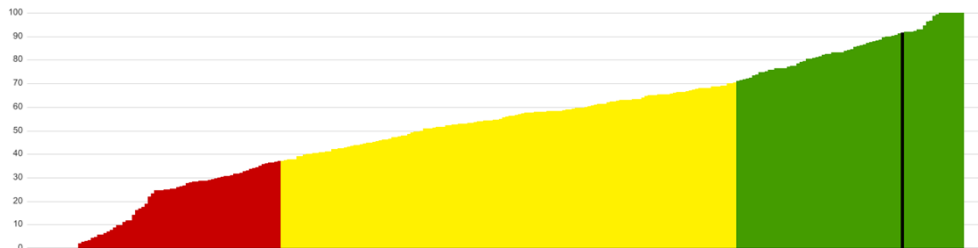
Kvalitetsindex förskola, Gotland, värde: 91, år: 2023.

Indexet baseras på andel med förskollärlärolegitimation i kommunal förskola, andel barn 1-5 år i kommunen inskrivna i förskolan och personaltäthet i kommunal förskola. Värdet placeras på en skala från 0 till 100 där 0 är sämst och 100 är bäst. Region Gotland har ett värde på 91.