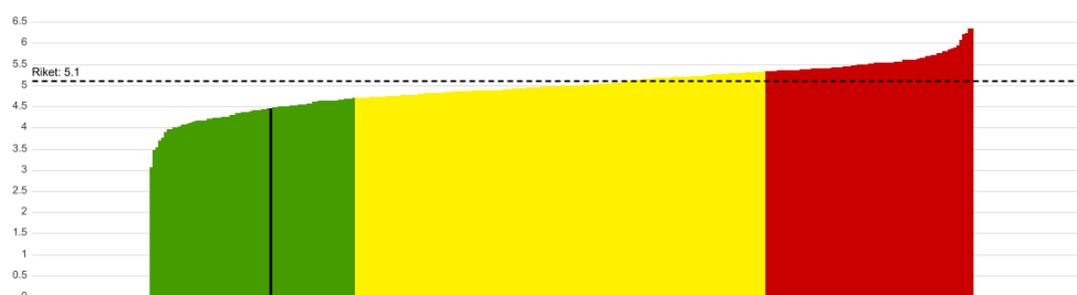
Jämförelse: Inskrivna barn per årsarbetare i förskolan, lägeskommun, antal, Gotland, värde: 4.5, år: 2023. Källa Kolada

När det gäller inskrivna barn per årsarbetare har Region Gotland en relativt hög personaltäthet i jämförelse med andra kommuner. Riket har ett genomsnitt på 5.1 barn/årsarbetare. På Gotland är det 4,5 barn/årsarbetare.