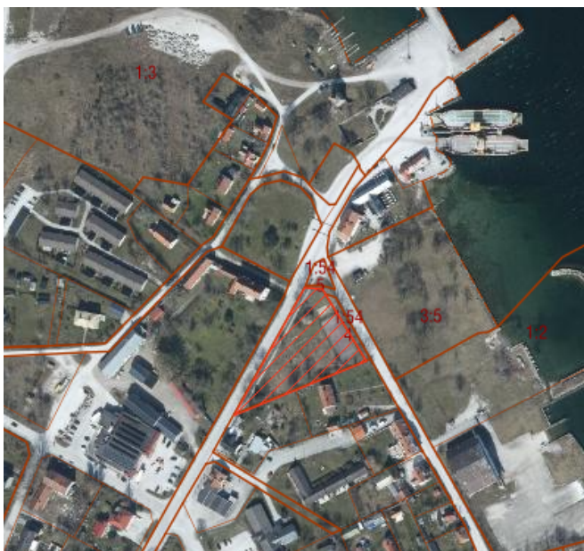
Fastigheten Gotland Bunge Kronhagen 3:4 markerad i rött.

Regionstyrelsen har 2021-09-01, § 241 beslutat om direktavvisning av mark till Resona Utveckling AB avseende fastigheten Gotland Bunge Kronhagen 3:4. Fastigheten är belägen centralt i Fårösund på norra Gotland ca 56 km från Visby. Markanvisningen avsåg möjliggöra för byggnation av flerbostadshus med hyresrätter inom fastigheten. Den 12 april 2023 återlämnade Resona Utveckling AB markanvisningen till Region Gotland med hänvisning till försämrade marknadsförutsättningar.