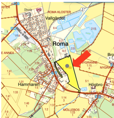
Figur, områdets lokalisering

Bolaget inkom den 19 december 2024 med en förfrågan till Region Gotland om direktanvisning av mark för utveckling av företagssymbios i Roma samhälle avseende del av fastigheten Gotland Roma Kloster 1:193.