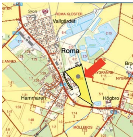
Figur, områdets lokalisering

Bolaget inkom den 19 december 2024 med en förfrågan till Region Gotland om direktanvisning av mark för utveckling av företagssymbios i Roma samhälle avseende del av fastigheten Gotland Roma Kloster 1:193.