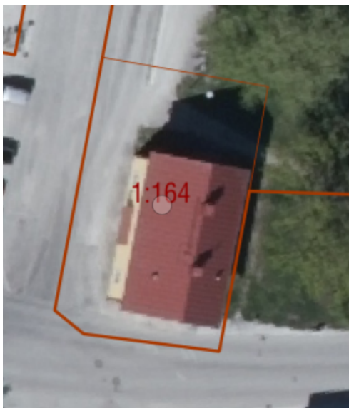
Figur ortofoto anseende fastigheten Klinte Strands 1:164

Hogrån Vismaränge-Langfångskog 1:2 försåldes 2025, TN § 9 2025-01-22.