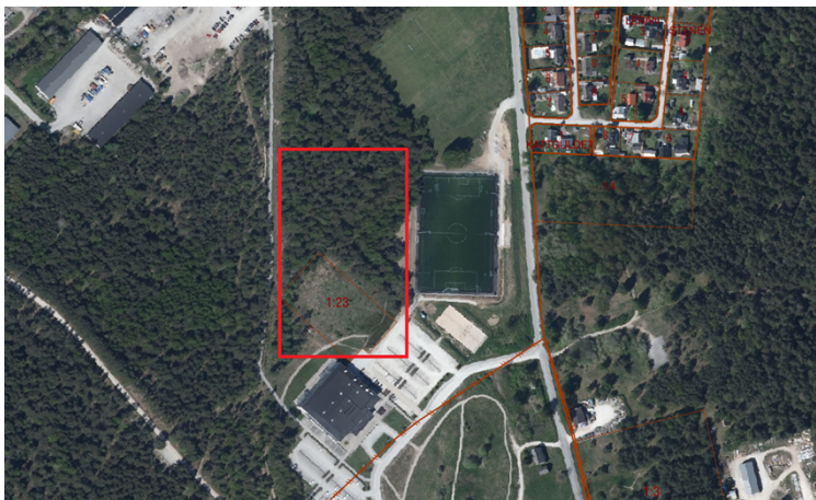
Figur 1. Område som byggherren önskar få markanvisning på för byggnation av en ishall. Fastigheterna Visby Visborg 1:23 och Visby Visborg 1:9 berörs. Områdets utformning specificeras i markanvisningsavtalet och fastställs genom kommande lantmäteriförrättning.

Regionstyrelsen beslutade 2025-03-04 (RS §82) att ge regiondirektören i uppdrag att teckna markanvisningsavtal med Visby Roma Hockey avseende upplåtelse av mark med tomträtt inom idrotts- och rekreationsområdet norr om arenahallen, Ica Maxi arena, i Visborg för nybyggnation av ishall.