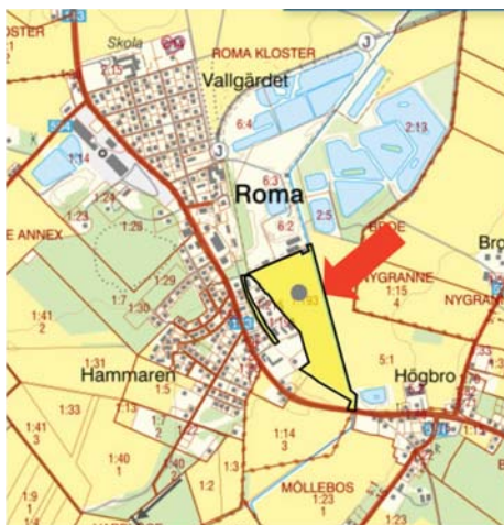
Figur, områdets lokalisering

Bolaget inkom den 19 december 2024 med en förfrågan till Region Gotland om direktanvisning av mark för utveckling av företagssymbios i Roma samhälle avseende del av fastigheten Gotland Roma Kloster 1:193.