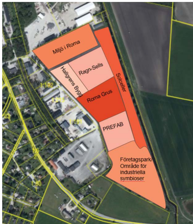
Figur, förslag om möjliga etableringar vid en framtida företagssymbios